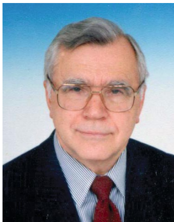
Старший вице-президент Торгово-промышленной палаты Российской Федерации

Торгово-промышленная палата Российской Федерации желает организаторам и участникам выставки, проходящей под ее патронажем, успехов в их благородном деле на благо здоровья нации!