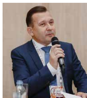
Зубков Виктор Васильевич